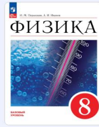
Физика. 8 класс Перышкин И. М., Иванов А. И.