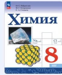
Химия. 8 класс Габриелян О. С., Остроумов И. Г., Сладков С. А.