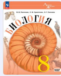
Биология. 8 класс Пасечник В. В., Суматохин С. В., Галонко З. Г.